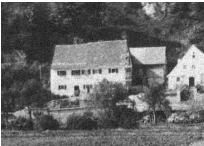
Das Grünerhaus vor dem Umbau in den Jahren vor 1900. Auf seinem Platz steht heute das Mätzner Haus