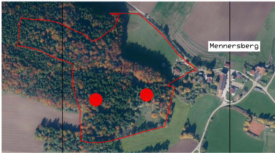
Lageplan, unmaßstäblich, mit gesamter Fl.Nr. 1303, Kartengrundlage: Amtliches Luftbild Maßstab siehe Maßstabsleiste unten - Beide Pläne sind genordet.

Bestand: "Es handelt sich um einen 80-100-jährigen Fichtenbestand mit einzelnen, etwa gleichaltrigen Buchen und Kiefern." (Schreiben vom 14.11.2018, AELF Amberg).